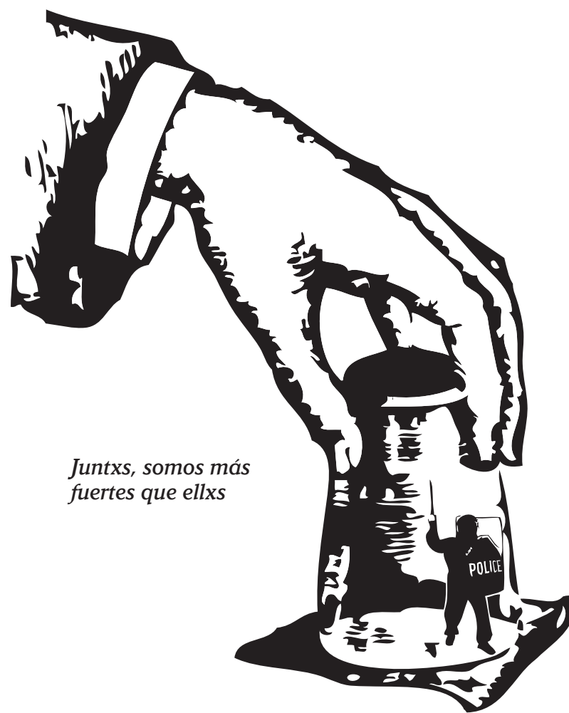
Juntxs, somos más fuertes que ellxs

Estas pequeñas victorias son especialmente inspiradoras para quienes están bajo el yugo de la violencia policial a diario. En el inconsciente colectivo de nuestra sociedad, la policía es el último bastión de la realidad, la fuerza que asegura que las cosas sigan como están; confrontarlx y ganar, aunque sea temporalmente, muestra que la realidad es negociable.