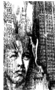
שירה נכתבת ע"י כולם, לא ע"י אחד! ... אבל זה עדיין בידיים שלנו לכתוב שירה.

מאחר ואנרכיסטים טוענים שיחסי חברות, או לפחות יחסי משפחה, יכולים להיות המודל לכל מערכות היחסים, אנחנו מוקירים מעל הכל את אותם תכונות שהופכות חברות טובה לאפשרית: אמینות, נדיבות, עדינות. לרובנו הנחילו היררכיה ותחרות מאז שנולדנו, וזה הופך את היכולת לתקשר בדרכים משחררות ולא מגבילות למעשה גבורה לא קטן, ועדיין – זה קורה כל הזמן! כל אחד מאיתנו מנסה לתת ללא לדרוש דבר חזרה, להיות בן אדם שאף אחד אינו צריך להרגיש מבויש או חסר נוחות לידו. נאמר שאנחנו מתנגדים לנישואים, אבל ההפך הוא היותר נכון: כן, אנחנו מדגישים שאף אחד אינו רכוש של האחר, אבל יותר מכך אנחנו אומרים שכל אחד על כדור הארץ הזה הוא למעשה נשוי – ואנחנו מתעקשים שכל אחד ינהג בהתאם לכך. כל זה אינו אומר שאנחנו ניגשים אל חיילים עם פרחים כשהם באים לקחת את ילדינו – ואף איננו מציעים לתאגידים את ילדינו כשהם באים לקחת את הפרחים שלנו. לעיתים רחוקות אהבה יכולה לדבר רק דרך קנה הרובה.